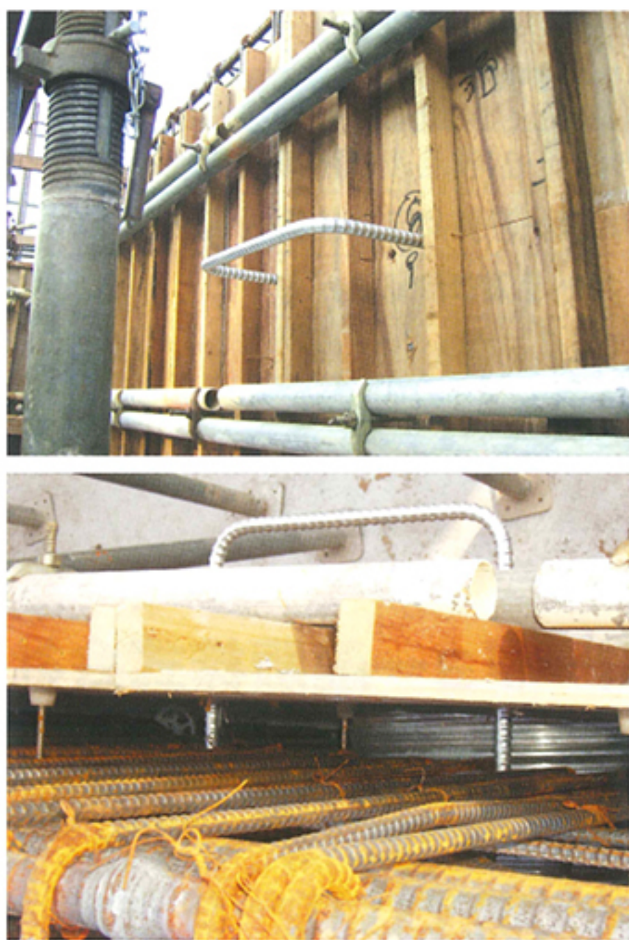
人通孔上部タラップ(正面および上部からの様子)

従来のステンレス製のクオリティを保ちつつ、 コストの削減を実現。建築現場のニーズにお応えします。